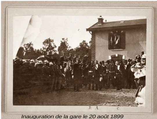
Inauguration de la gare le 20 août 1899

2021 est une année anniversaire pour notre commune. En effet, le train a fait ses derniers passages lors de l'année 1971. Ce que l'on nomme aujourd'hui le chemin de la gare était à l'origine une ligne de chemin de fer reliant Brou à La Loupe.