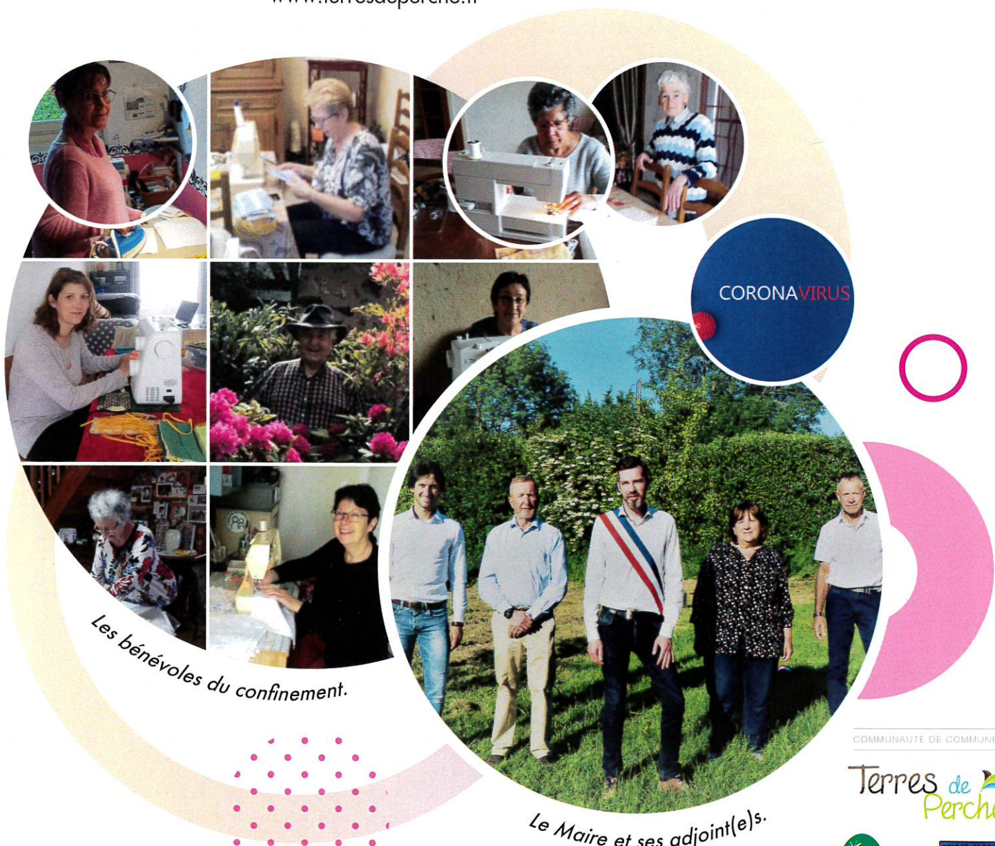
Les bénévoles du confinement.