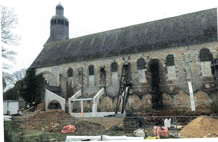
2018 verra l'étude de la seconde phase : la toiture et l'aménagement des abords de l'Eglise.