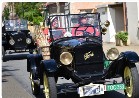
Dans le centre-ville de Thiron-Gardais.