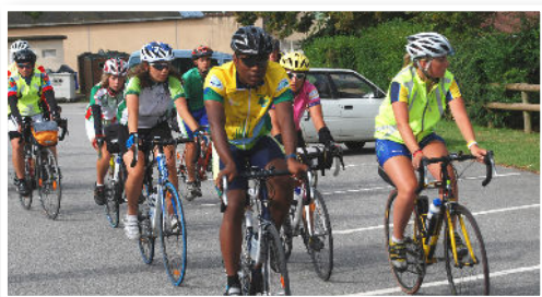
Le 2 août, des cyclotouristes venus de la France entière s'arrêteront à Thiron-Gardais.