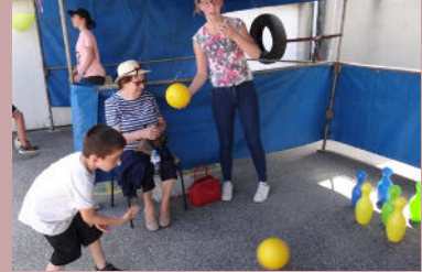
Les enfants se sont essayés au bowling.

Le dimanche 25 juin, l'école primaire des Enfants de Renart a organisé sa kermesse de fin d'année. Une formule renouvelée puisque l'animation s'est tenue cette fois-ci dans la cour de l'école primaire. Grâce à une coopération plus resserrée entre l'équipe pédagogique et l'association des parents d'élèves "Les Marmots", des chants et danses réalisés par les élèves du CP au CM2 sont venus compléter les stands de jeux. A l'issue de la prestation des enfants, des livres ont été distribués aux CM2 qui passent en classe de 6ème l'an prochain.