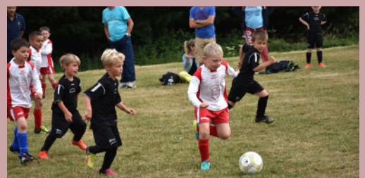
Les petits ont déjà de l'allure balle au pied.

On vous le dit : L'AST informe qu'elle recherche des éducateurs bénévoles pour la saison prochaine au niveau des U13. Il s'agit de s'occuper des enfants lors de l'entraînement du mercredi et d'accompagner l'équipe en match le samedi. Si vous êtes intéressés, contactez directement le club.