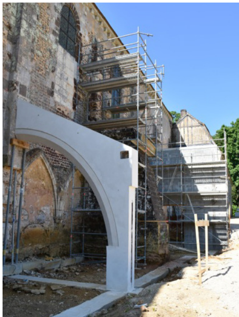
La première arche a été posée en mai. Dans le prolongement, le contrefort en partie démonté et au fond le mur de l'ancien cloître en cours de réalisation.

Les travaux de consolidation du mur nord de l'abbaye ont connu un coup d'arrêt inattendu fin mai-début juin. Certes, la première arche en béton est bien arrivée sur place. Elle a d'ailleurs été positionnée de façon à reposer sur l'ancien contrefort roman encore visible. Les ouvriers ont alors débuté le démontage du contrefort plus contemporain situé à proximité. Or, cette intervention a entraîné un léger mouvement du mur de quelques millimètres perçu par les capteurs de surveillance situés sur le haut de l'édifice. Par sécurité, le démontage a été stoppé. Cet incident est-il de nature à remettre en cause la poursuite du chantier ? Plusieurs réunions ont tenté d'y répondre. Victor Provôt, le maire, s'est interrogé sur la méthode de travail définie au départ et tenté d'obtenir des certitudes quant à la réalisation complète des travaux. Il s'est également inquiété de la sécurité dans la mesure où l'abbaye est pour l'instant ouverte au public. Dans l'immédiat, il a été décidé d'arrêter la dépose des contreforts datant du 19 ème siècle. L'architecte du patrimoine, Maximilien Philonenko, a confirmé que l'on ne touchera pas non plus à deux des quatres étaielements en bois se trouvant sur la partie Est du mur « tant que des alternatives réalistes n'auront pas été apportées aux difficultés rencontrées. » Pour autant, la pose des arches se poursuit ainsi que l'habillage du mur ouest en moellons.