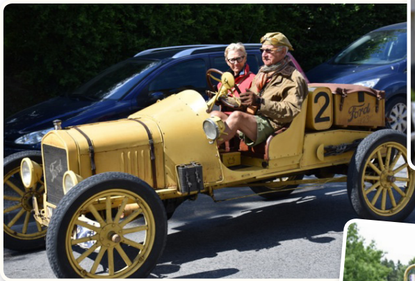
Tout est dans le souci du détail. Les tenues du début du siècle étaient de sortie.

d'Henry Ford le constructeur visionnaire, croisé des Anglais, Belges, Allemands, Espagnols ou Américains et découvert les secrets de ces voitures restaurées avec goût. Après une visite du collège royal et militaire suivie d'une collation, les belles anciennes ont repris la route sans accroc. Direction La Bazouche-Gouët où elles ont à nouveau fait sensation au comice agricole.