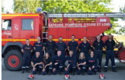
Les sapeurs pompiers, toujours prêts à intervenir.

Le centre de secours de Thiron-Gardais compte à ce jour 23 sapeurs-pompiers volontaires qui sont prêts à intervenir dès qu'ils sont bipés à toute heure du jour et de la nuit. Leur engagement est essentiel pour se porter le plus rapidement possible au secours des automobilistes lors d'accidents routiers ou sur des terrains d'interventions divers (feux, aide à la personne, destruction d'insectes nuisibles, etc.). L'an passé, 257 sorties ont été réalisées. Or, ce chiffre ne cesse d'augmenter. Le volontariat est donc essentiel pour permettre au centre de secours de fonctionner. Voilà pourquoi: « nous recrutons régulièrement de nouvelles personnes pour élargir notre