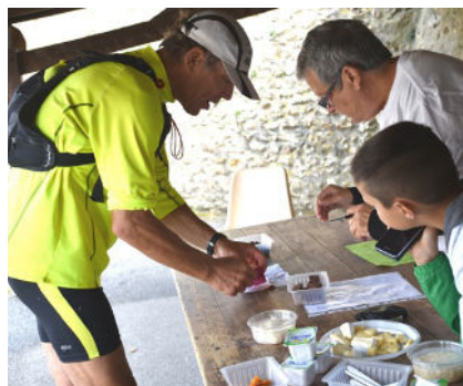
A la pause ravito, les marcheurs étaient accueillis par une équipe de bénévoles très dynamique.

La 8ème édition des 100 km du Perche a tenu toutes ses promesses. L'épreuve organisée le 1er juillet par Patrice Bouhours et de très nombreux bénévoles a attiré 520 participants. « C'est un très bon chiffre d'autant qu'il y a d'autres rassemblements du même type ce week-end », a reconnu l'organisateur lors de son passage au ravitaillement à Thiron-Gardais. La marche à allure libre a de nombreux adeptes. Dans le Perche, les inscrits avaient le choix entre trois randonnées (25, 50 et 100 km). De quoi éprouver les organismes. Comme d'habitude, le départ a été donné sur la place de l'église à Trizay. Les marcheurs ont pu profiter des points de ravitaillement disséminés sur le parcours. A Thiron-Gardais, l'intendance s'était installée dans la cour de l'école primaire. Boissons, collation et détente musculaire ont remis d'aplomb nos forçats de la marche. Tous sont repartis du bon pied et avec le sourire.