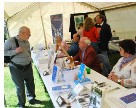
Les auteurs vont venir à la rencontre de leur public.