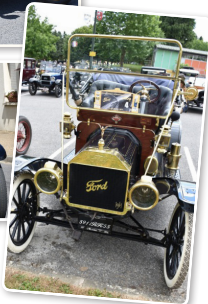
Une magnifique FORD T rénovée avec goût. Allez, on vous emmène !