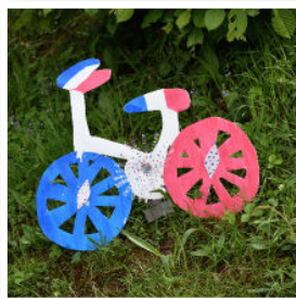
Un peu partout dans le village, le vélo se décline d'une façon originale. Bravo Yvette !

Grâce au travail de la commission fleurissement, la commune s'est mise aux couleurs de la petite reine.