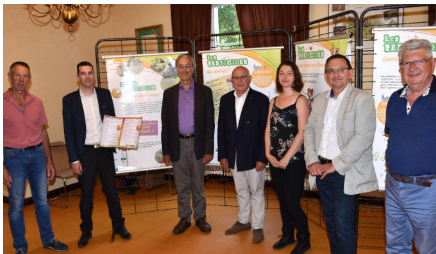
A l'issue de la signature dans la salle du conseil municipal.