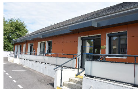
La Maison de santé fonctionnera bientôt à 100 % de ses capacités.

Rappelons pour finir, que la Maison de santé, quasiment de plain pied, est accessible à toute forme de handicap. La nouvelle structure a été conçue dans l'intérêt du patient avec une offre de soins pérenne et diversifiée.